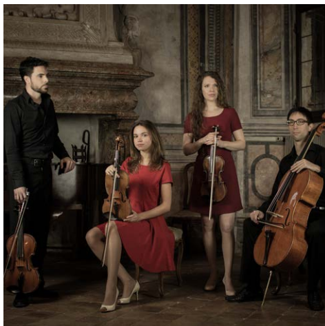
domenica 27 maggio All'ombra di Stalin Prokofiev e Shostakovich Quartetto Intime Voci, Lugano (Svizzera)

Fondato nel 2014, il Quartetto Intime Voci nasce dall'incontro di quattro musicisti avvenuto durante gli studi presso il Conservatorio della Svizzera italiana e dal loro desiderio comune di dedicarsi in modo appassionato e intenso alla musica da camera. Dopo un ricco percorso musicale individuale intraprendono insieme un nuovo cammino dedito all'approfondimento e al perfezionamento dell'esigente pratica del quartetto. La loro attività concertistica li porta in Svizzera, Francia e Italia. Nel 2015 conquistano un posto nella classe del rinomato professore e quartettista Rainer Schmidt (del Hagen-Streichquartett) presso la Musik-Akademie di Basilea, con il quale frequentano un corso post-laurea biennale, oltre ad una masterclass internazionale presso il Mozarteum di Salzburg. Il Quartetto Intime Voci rende omaggio con la scelta del proprio nome alla composizione per quartetto d'archi "Voces Intimae" del compositore finlandese Jean Sibelius.