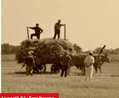
I progetti di Le Terre Traverse