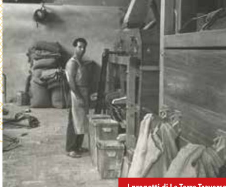
I progetti di Le Terre Traverse